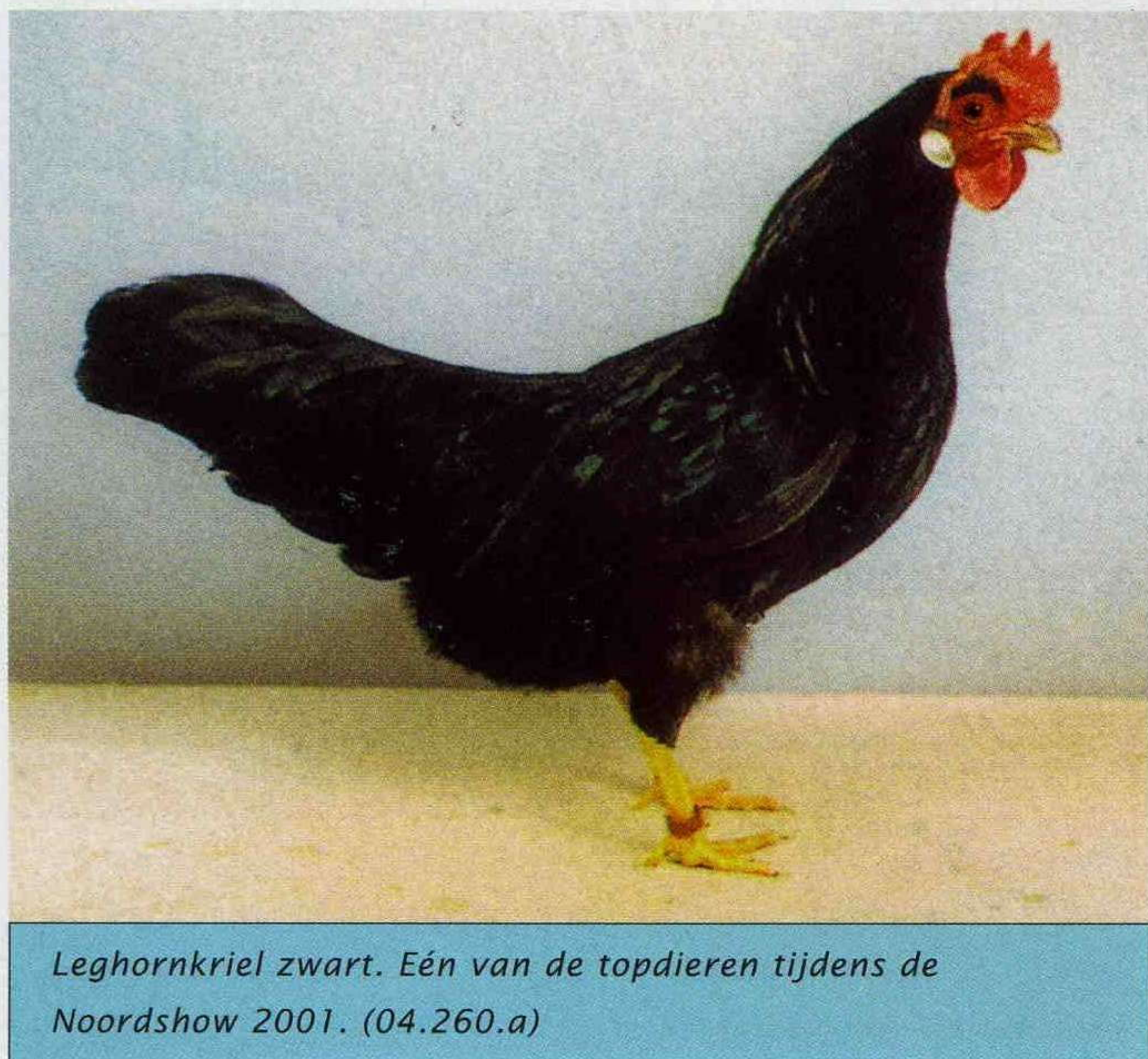
Leghornkriel zwart. Eén van de topdieren tijdens de Noordshow 2001. (04.260.a)

De NHDB standaard maakt die uitzondering ten aanzien van de donskleur voor geelbenige rassen niet voor niets.