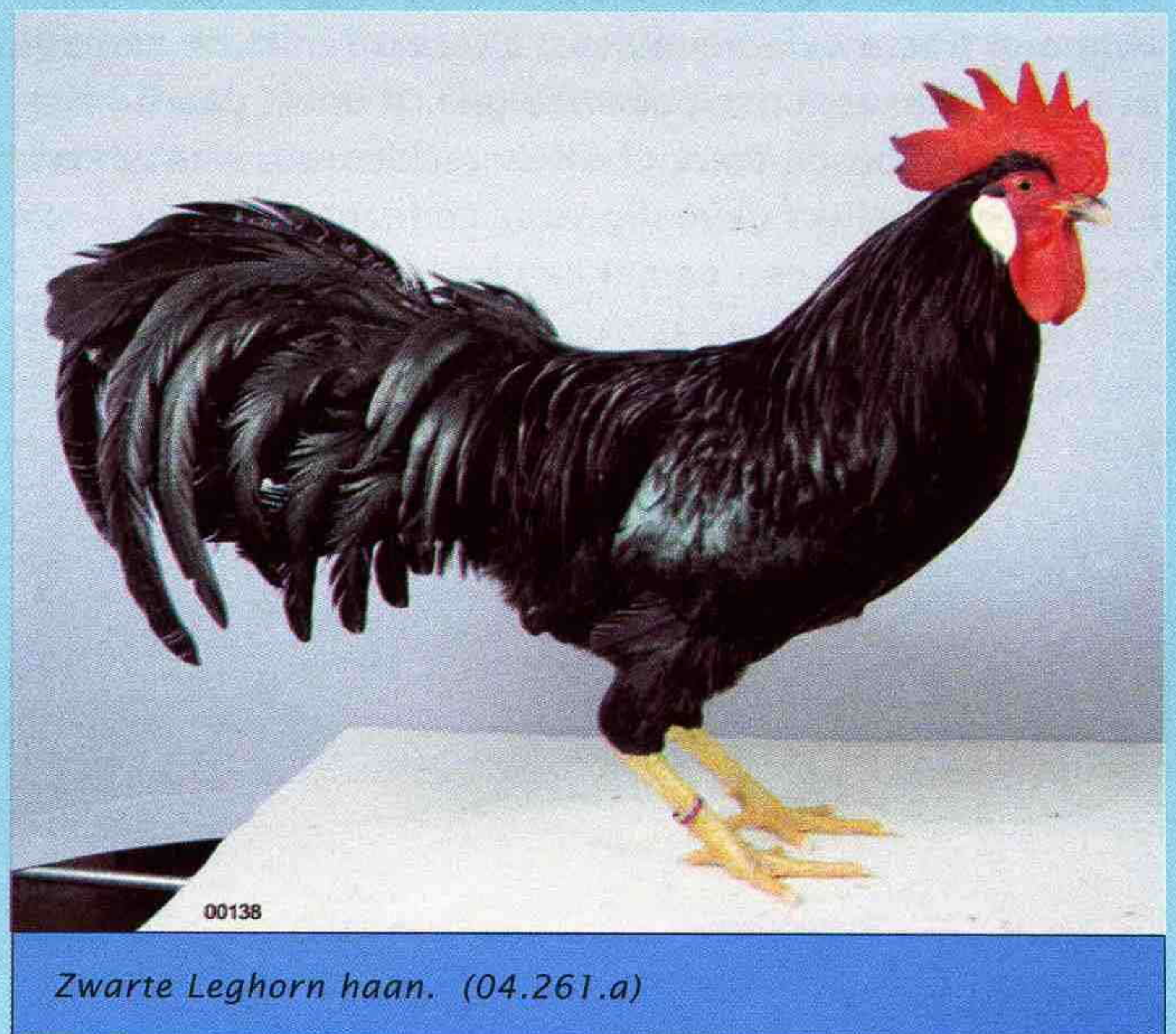
Zwarte Leghorn haan. (04.261.a)

Het ras is met enkele kam en met rozenkam erkend ofschoon dieren met een rozenkam waarschijnlijk niet meer in Nederland voorkomen. De enkele kam die bij de haan rechtop moet staan is middelgroot met vijf tot zes brede, diep ingesneden kamtanden en een flink ontwikkelde kamhiel. Deze kamhiel moet de hals gedeeltelijk volgen maar vrij van de schedel blijven. De kam van de hen moet van achteren omvallen, zodanig dat het zicht niet belemmerd wordt.