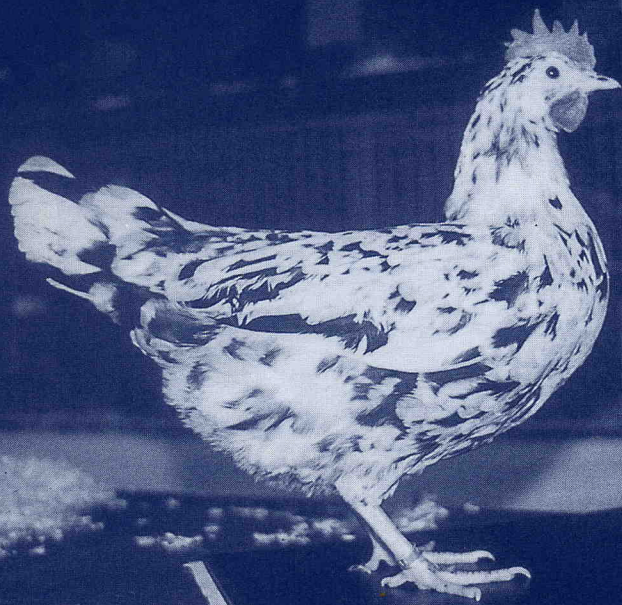
Deze hen laat een prima kleurverdeling zien. (02.143.a)

Leghornman Aalt van der Streek. Hij was al 15 jaar in het bezit van een heel oude stam Exchequers, met de bekende fouten in kopversierselen en type, met daar naast ook veel nakomelingen met kromme tenen. Allereerst selecteerde hij zijn fokdieren streng op de teenfouten en de verkeerde kopversierselen. Vervolgens ging hij er toe over de broedieren te wegen. Alle eieren onder de 65 gram sloot hij uit voor de fok. Dit vereiste kleine tomen en een heel nauwkeurige administratie. De grootte en vitaliteit van zijn nakomelingen werden hierdoor sterk verbeterd. De volgende stap was een opmerkelijke: op aanraden van een oude nutfokker probeerde hij de kruising van een Rhode Island Red hen met een exchequer Leghorn haan. De F1 gaf alleen zwarte dieren. Toen hij de beste types van deze F1 het jaar daarop paarde aan een exchequer haan, vielen uit deze combinatie roodgeschouderd witte dieren (we noemden ze toen Pile) en zwarte dieren met enkele rode veren. De roodgeschouderd witte dieren werden opnieuw gepaard met een zuiver zwartbonte haan. Het resultaat was een groot aantal goede zwartbonte en zwarte dieren. De rode oren van de Reds waren geen enkel probleem geweest. Deze werkwijze bracht hem een enorme vooruitgang in type en vitaliteit bij zijn dieren.