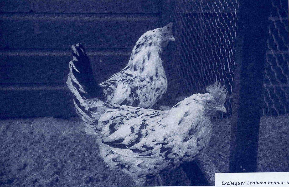
Exchequer Leghorn hennen in de ren. (02.144.a)

Leghornclub is graag bereid om op te treden als contactpersoon voor nieuwe fokkers, om hen van goede fokdieren te voorzien, en fokadviezen te geven.