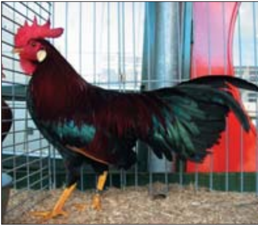
Deze bruinpatrijs krielhaan toont de juiste kleur. In de praktijk is de hals en zadeltekening wat minder intensief als bij patrijs.