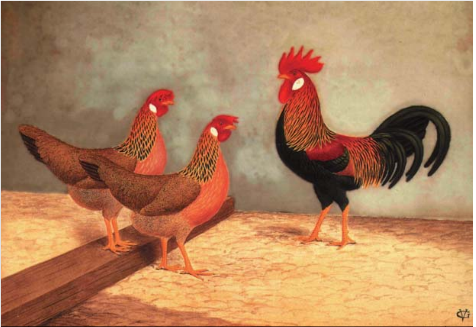
De kleurslag patrijs, de basis voor alle overige patrijskleurslagen bij de Leghorns.