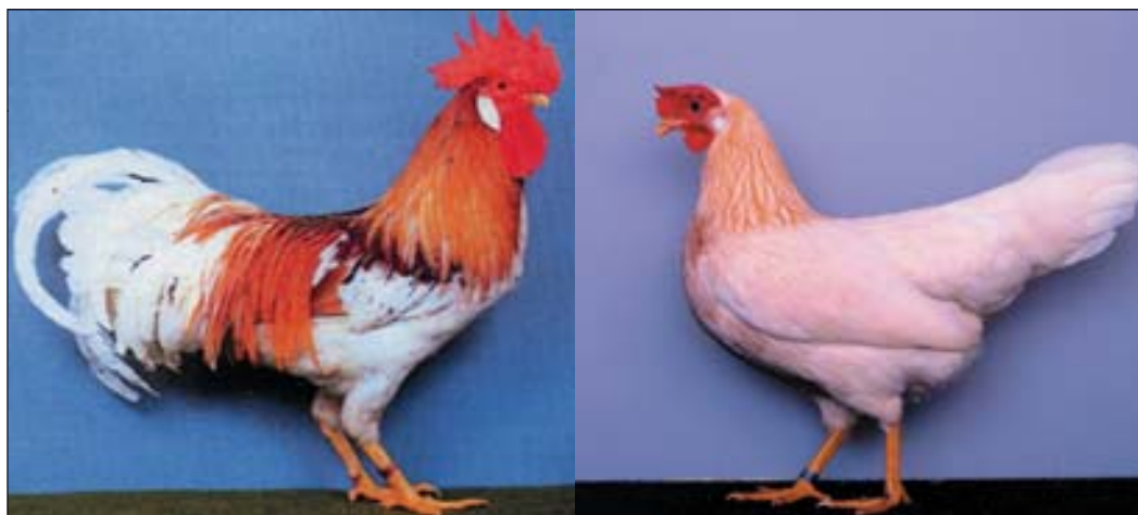
Roodgeschouderd wit, haan en hen. Bij deze fraai getekende haan is praktisch alle zwart door het dominante wit onderdrukt. Bij de hen is de gehele bevedering wit met uitzondering van de goudgele halskraagbevedering met witte schachtstreepstekening en de zalmkleurige borst.

Ook een kleurslag dus, waarmee de fokker steeds balanceert tussen twee kwaden. Daarom wordt ten gunste van een intensieve kleur een weinig zwart in de sikkels en wat puntjes in de vleugelband voor lief genomen.