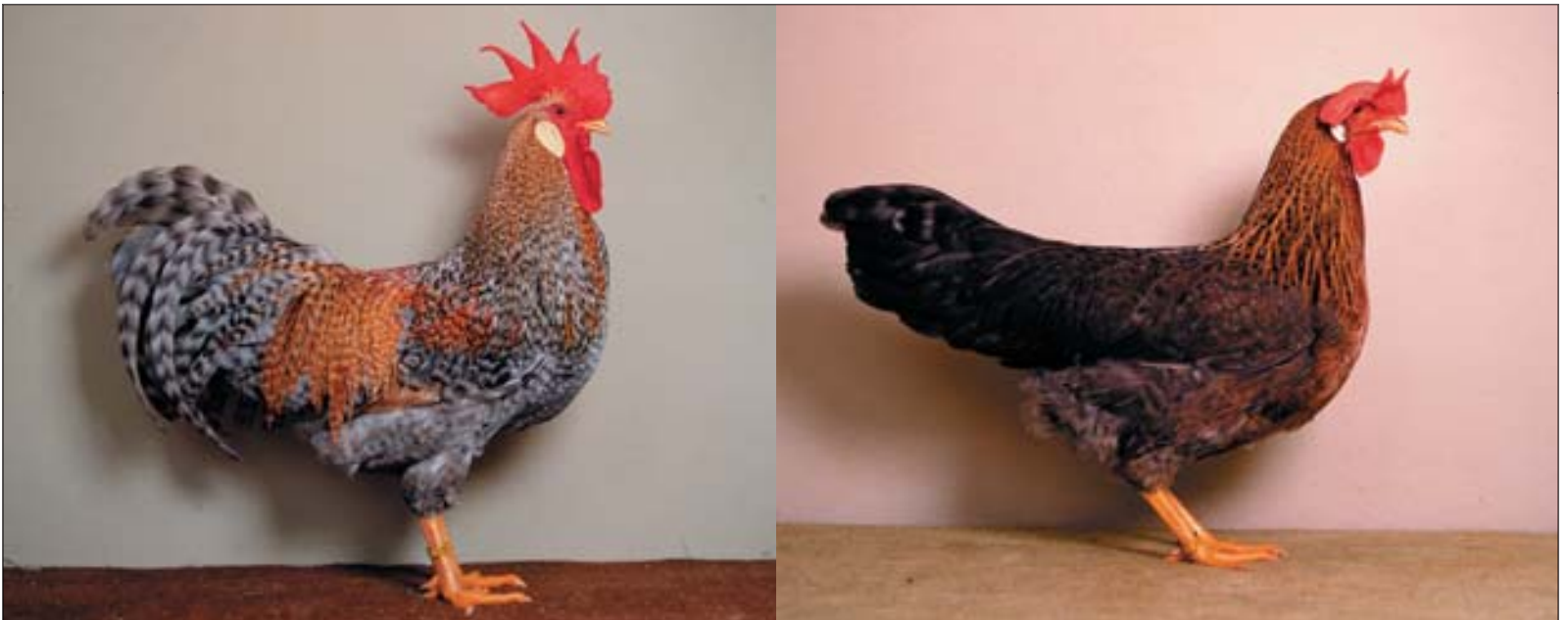
Koekoekpatrijs haan en hen. De afbeelding van de hen laat zien wat bedoeld wordt met de beschrijving patrijs met koekoekfactor. Velen hebben daar een andere voorstelling bij.

Paar je F1 roodgeschouderd witte dieren aan elkaar,