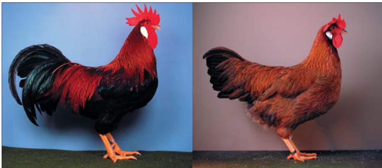
Patrijs goudflitter Leghorns. Let op de kleur van de haan. Die is duidelijk een tint donkerder dan patrijs. De flittertekening op het vleugeldeuk van de hen moet wat sprekender.

Verder zijn borst, buik en dijen zwart met een lichtbruine omzoming. Toeping is toegestaan maar niet gewenst, ook niet voor de fok. Met name de zoming in de flanken is belangrijk voor een goede zoming op de schouders bij de hennen.