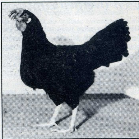
Zwarte Leghorn, hen; 1 F op een der laatste B.T.T. (foto C. Aalbers)

Wat zijn nu de wezenlijke verschillen? Om te beginnen met het Amerikaans Type. De hanen hebben een dikkere, vlezige kam