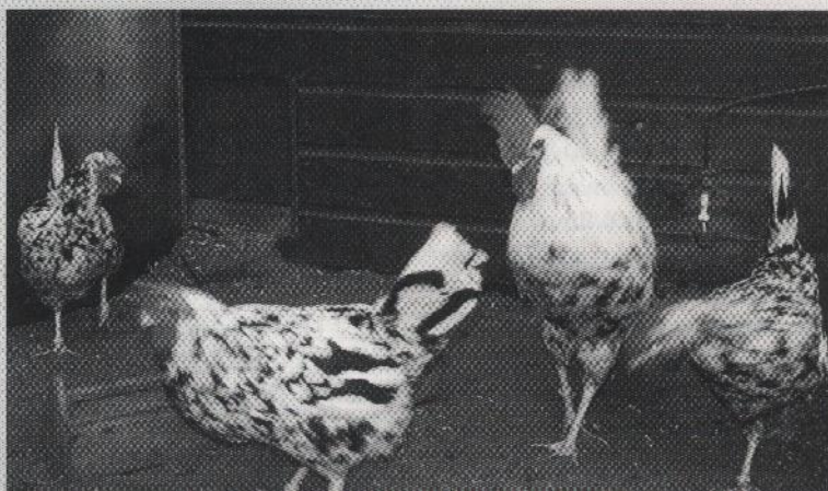
Exchequer Leghorns (groot).

of kleurslagen wordt aan zijn lot overgelaten. Het zou mooi zijn als je van de Bond (NIIDB) een aanwijzing zou krijgen hoe je bijzondere rassen of kleurslagen het best kunt fokken. Of dat er door b.v. de speciaalclub, museumboerderijen, landbouwscholen of dergelijke instellingen, die iets te doen hebben met kleindieren, een fokprogramma wordt opgesteld om aan deze fokkers te overhandigen."