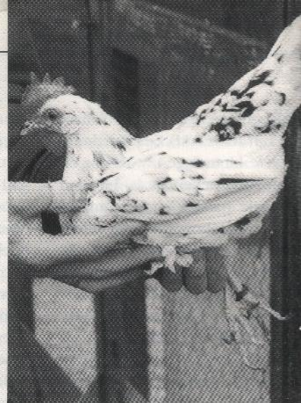
Oude krieblen Exchequer Leghorn.