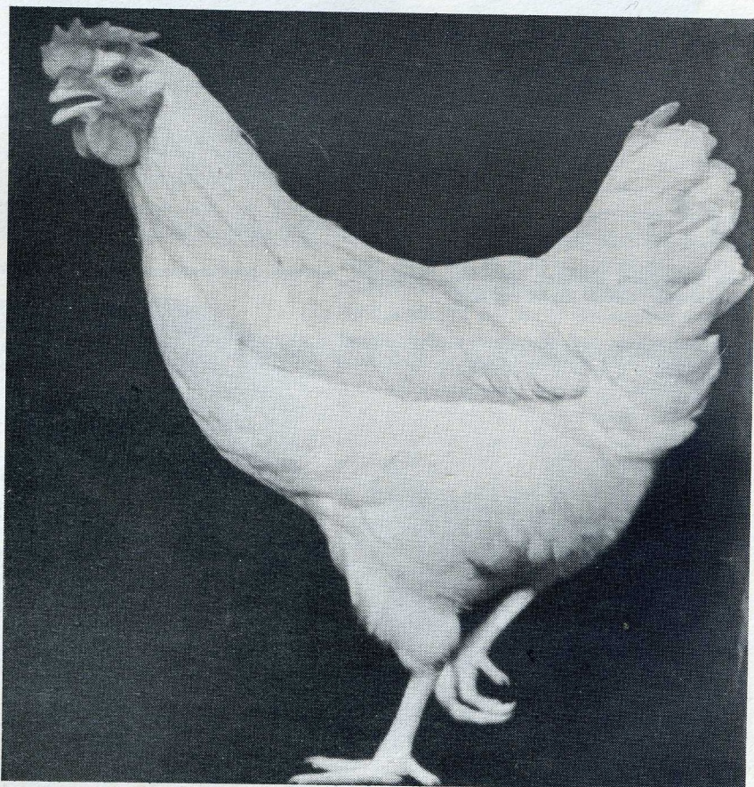
Witte Leghorn hen.

Voor de tentoonstellingen moeten de witte Leghorns zuiver wit zijn, dus niet geel of crème. Bij de zwarte kleurslag is het gevederde groenglanzend. Voor de fok moet men hanen gebruiken met een donker dons. De zwarte kleurslag is het eerst in Engeland gefokt die door import van Duitse dieren sterk zijn verbeterd. Bij de buff Leghorns is de kleur warm goudkleurig. De onderkleur is ook buffkleurig. Voor de fok moet men dieren gebruiken die zoveel mogelijk gelijkmatig van kleur zijn. Opgemerkt wordt dat in de staart geen wit mag voorkomen. Een mooie verschijning is ook de blauwe Leghorn, doch deze geeft nogal moeilijkheden